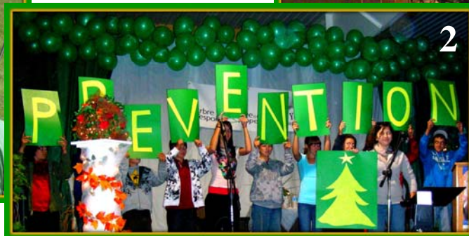
2 – Lancement de la campagne de l'Arbre de l'espoir

C'est grâce à des gens engagés comme vous que nous pouvons réussir à offrir des soins de qualité aux gens atteints du cancer. Continuez votre beau travail !