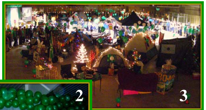
3 – Marche de l'espoir de Rogersville