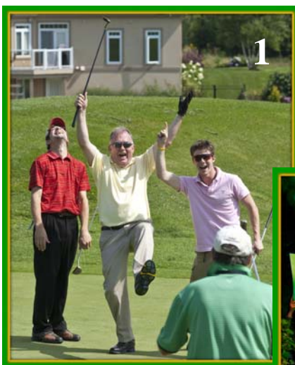
1 – 8 e Classique Banque Scotia-BMW Moncton de l'Arbre de l'espoir